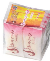
「越中富山湾 白えびかき餅 14袋」 株式会社御菓蔵