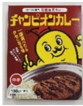
「チャンピオンカレー（中辛）」 株式会社チャンピオンカレー+TK