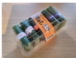
「連子鯛入り三味笹寿し」