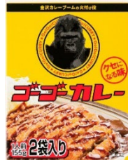
「ゴーゴーカーレーレトルト（2食入り）」 日本製菓株式会社 ボルカノ食品事業部