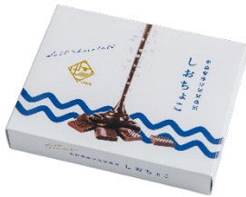
「しおちょこ」 株式会社 Ante