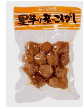
「福井県奥越 里芋の煮ころがし」 有限会社米又