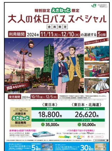
【大人の休日パス SP ポスター】