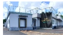
十日町すこやかファクトリー