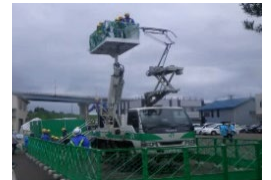
メンテナンス車両 乗車コーナー