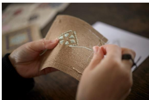
青森県・津軽こぎん刺し 制作体験