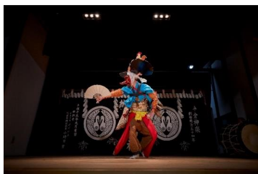
岩手県・「とおの物語の館」での神楽鑑賞