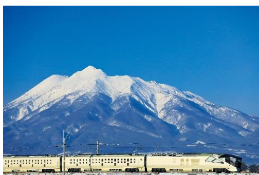
冬化粧をした岩木山を背景に走行する 「TRAIN SUITE 四季島」