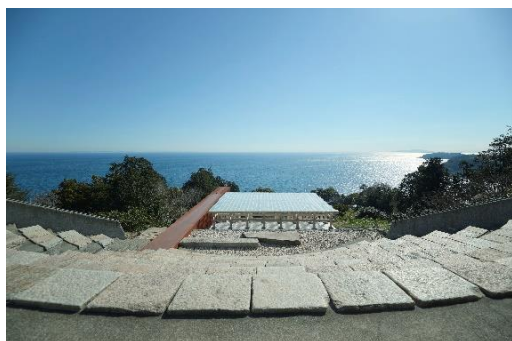
神奈川県・江之浦測候所