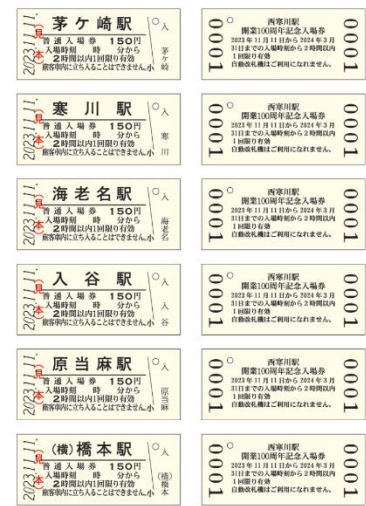
相模線 6 駅の入場券（硬券）