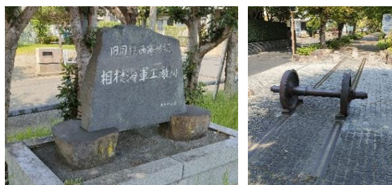
廃線後に整備された八角広場（左）と一之宮緑道（右）

現在その跡地は公園として残されており、線路跡も遊歩道として整備され、現在も地域の皆さまに散策されるなど親しまれています。