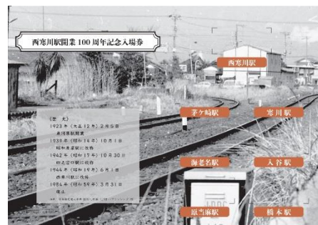
オリジナル台紙（中面）