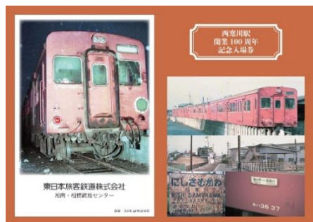
オリジナル台紙（表面）