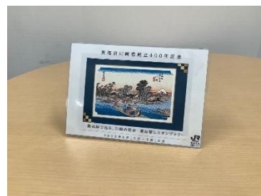
【オリジナルフレームスタンド】

※画像等はすべてイメージです。 ※イベント内容は、予告なく変更・中止となる場合があります。