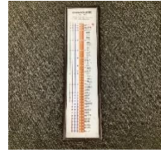
鉄道古物景品イメージ

※ご参加にはスタンプ設置駅までのきっぷ(乗車券)または、Suicaが必要になります。