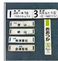
鉄道古物景品イメージ

・2024年3月24日(日)までに抽選応募券を市ヶ谷駅にお持ちください。抽選応募券がないと、当選は無効となります。