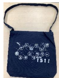
オリジナル記念 トートバッグイメージ