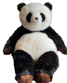
34年前に贈呈した パンダのぬいぐるみ