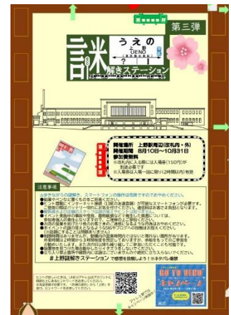
パンフレット(イメージ)

※上野駅までの運賃や、改札内に入る際の入場券が別途必要になります。 ※謎を解く際に、改札の入場・出場が必要になります。