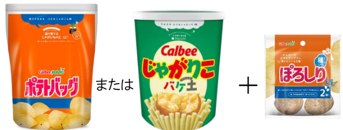
【配布セットイメージ】