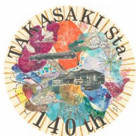
SL 高崎駅140年水上 SL 高崎駅140年横川

「SL 高崎駅140年水上」「SL 高崎駅140年横川」には、高崎市に縁のある美術作家 山形敦子氏によるデザインを、「EL 高崎駅140年横川」には、一般の皆さまから募集したデザインの中から、最優秀作品に選ばれたものをヘッドマークとして掲出します。