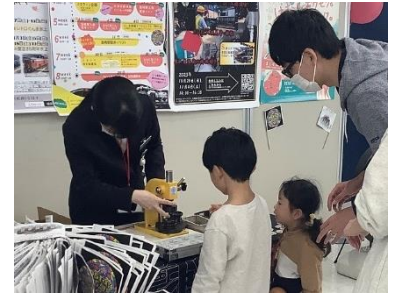
缶バッジ作成体験

高崎おとまちプロジェクトとの連携によるステージイベント、高崎観光協会による“機関車の街高崎マルシェ”、高崎駅社員によるデジタルよろず相談所の開設、缶バッジ作成体験などを行います。マルシェには、高崎銘菓・名産品をはじめ、高崎産の新鮮な農産物や高崎が誇る伝統工芸品である高崎だるま®が並びます。また、子どもから大人まで楽しめる、だるま輪投げやだるまの絵付け体験を実施します。