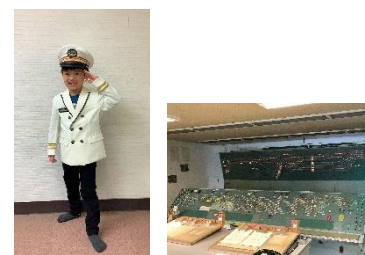
懐かしの高崎駅 1 番線イベント