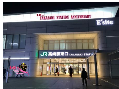
東口メインエントランス