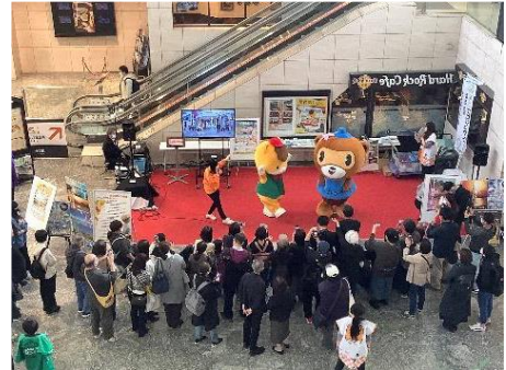
〈2022年の観光PRイベントの様子〉