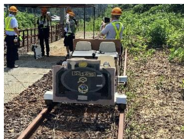
▲レールスター体験