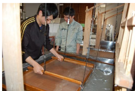
小川和紙の紙漉き体験