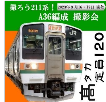
撮ろう211系! A36編成 撮影会