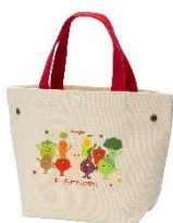
カスタムトートバッグ