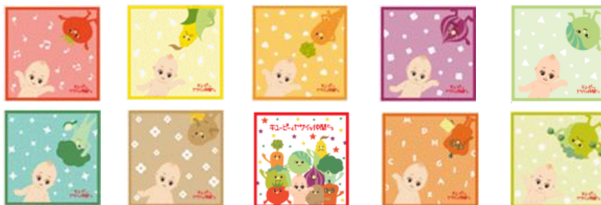
タオルコースター10種