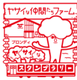
スタンプイメージ