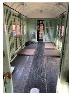
【オハニ 36 荷物室内】