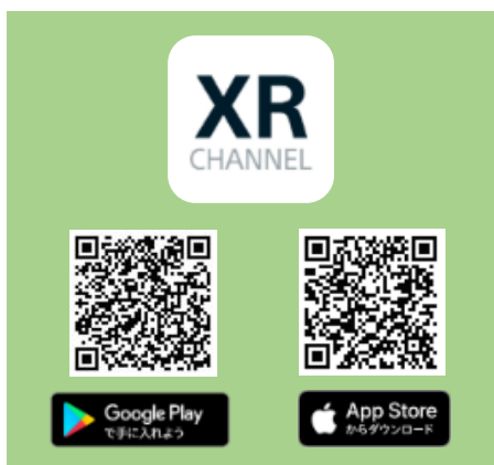
AR アプリ「XR CHANNEL」

以下の二次元コードからスマートフォンアプリ「XR CHANNEL」をダウンロードの上、コース内の各ポイントでアプリを立ち上げ、スマートフォンをかざしていただくと画面内の景色の中に説明が浮かび上がります。