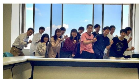
高崎経済大学観光まちづくり研究室

こんにちは！私たちは高崎経済大学で観光を通じた地域活性化について学んでいる観光まちづくり研究室です！ 私たちが作った駅からハイキングコースは、前橋駅周辺を歩きながら、たくさんの芸術作品と巡りあうことができます。 形や名前がおもしろい作品がたくさん見つけれられるかも！ さらに、学生と一緒に歩くガイドツアーや前橋駅構内でフィンガーペイントのイベントも実施します！ 冒険の中であなたの知らない前橋を一緒に見つけていきましょう！！