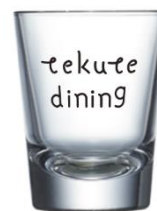
tekute dining オリジナルグラス