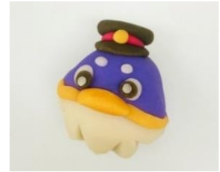
「つどりい」オリジナルお菓子