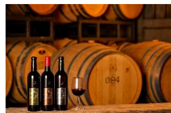
月山トラヤワイナリー

※この旅行商品は、2月28日より発売開始しております。 ※旅行代金などの詳細は、申込みサイトよりご確認ください。