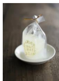
勘次郎胡瓜のジュレ