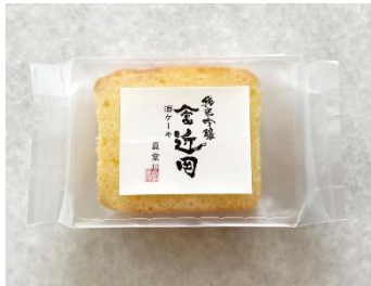
やま富近岡酒ケーキ