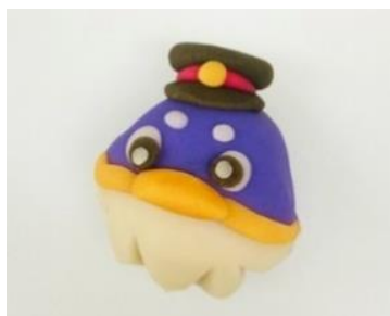
「つどりい」オリジナルお菓子