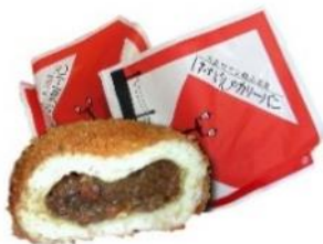
はいからさんのカレーパン