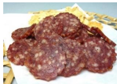
米沢牛入スライスさらみ