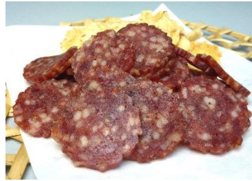
米沢牛入スライスさらみ