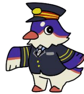
JR東日本山形エリアマスコットキャラクター 「つどりい」