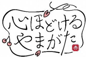
山形県春の観光キャンペーン ロゴマーク

また、3月1日（金）～3日（日）は山形県観光PRキャラクター「きてけろくん」、3月1日（金）はJR東日本山形エリアマスコットキャラクター「つどりい」が登場し、2024年4月1日から6月30日まで行われる「山形県春の観光キャンペーン」を始めとするPRや会場のにぎやかを行います。