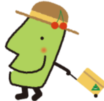
山形県観光PRキャラクター 「きてけろくん」