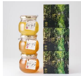
「ARCADIA PURE HONEY