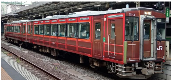
【キハ110系（レトロラッピング車両）】

2024年4月1日から6月30日の間、山形県春の観光キャンペーンを開催します。地域の魅力ある美食・美酒、温泉、自然などが揃う「心ほどけるやまがた」へのおでかけにぜひご利用ください。