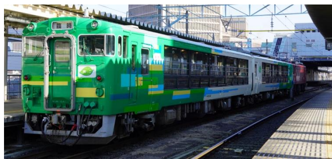
【びゅうコースター風っこ】