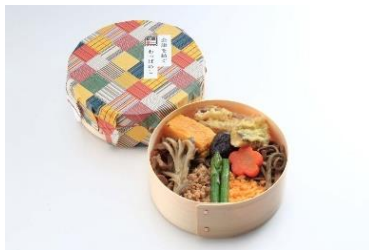
【会津を紡ぐわっぱめし】