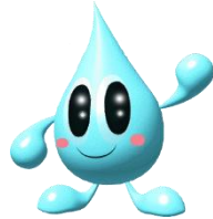
福島県 県南地方振興局キャラクター 「みなもん」