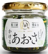
「松川浦かけるあおさ」 (株) マルリフーズ

揚げたニンニクなどと一緒にゴマ油に漬けた松川浦産のアオサは、ご飯やパスタ、冷ややっこなど様々なメニューのトッピングとして楽しめる万能の商品です。「相馬ブランド」として認定。