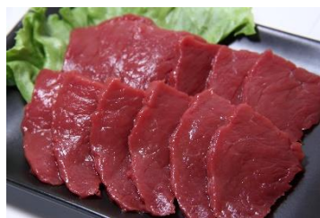
「国産馬刺し」 馬さしの鈴静

揚げたニンニクなどと一緒にゴマ油に漬けた松川浦産のアオサは、ご飯やパスタ、冷ややっこなど様々なメニューのトッピングとして楽しめる万能の商品です。「相馬ブランド」として認定。