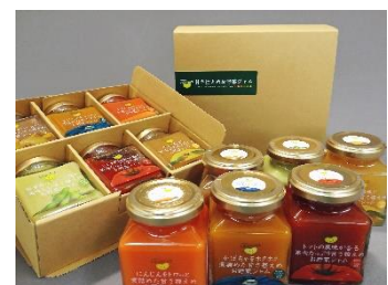
「甘さ控えめお野菜ジャム」 東栄産業(株)

会津の名物「馬刺し」の専門店として60年以上営業する馬刺し・馬肉専門店です。低カロリー・高タンパクのとてもヘルシーな馬刺しを「ニンニクと一味唐辛子がガッツリ効いた自家製タレ」と一緒に召し上がり下さい。