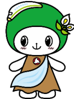
西郷村イメージキャラクター 「ニシゴージュ」