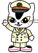
JR 東日本 水戸支社 E657 系 イメージキャラクター 「ムコナくん」