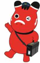
JR 東日本 会津若松エリアプロジェクト オリジナルキャラクター 「ぽぽべえ」