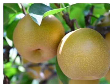
特産の梨 (芳賀郡 芳賀町)