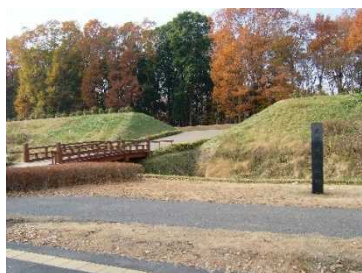
飛山城史跡公園 (竹下町)

LRT 沿線の「飛山城史跡公園」、美味しい日本酒の造り酒屋「宇都宮酒造」をパンフレットでご紹介しています。また、LRT の東側の終点である芳賀町は梨の生産が盛んです。今年の秋は LRT に乗って、美味しい梨や観光をお楽しみください。