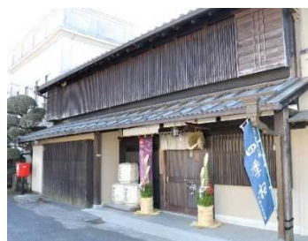
宇都宮酒造 (柳田町)