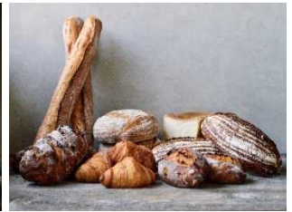
THE STANDARD BAKERS 大谷本店 (大谷町)