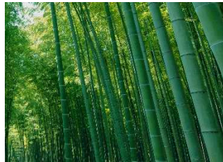
若竹の杜 若山農場 (宝木本町)