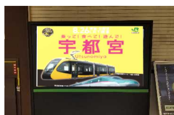
駅デジタルサイネージ