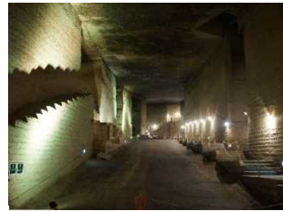
大谷資料館 (大谷町)