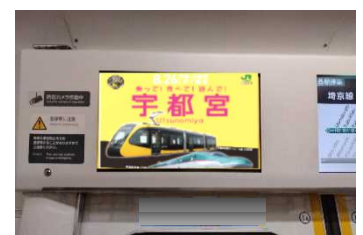
トレインチャンネル