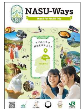
専用パンフレット

NASU-Ways サービス開始に合わせて、「JR とバスで旅する那須・塩原（那須編・塩原編）」のイメージ動画をYouTubeのJR 東日本公式チャンネルにて配信します。（8月1日以降配信予定）