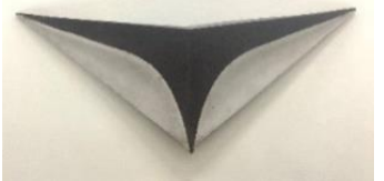
特急シンボルマーク