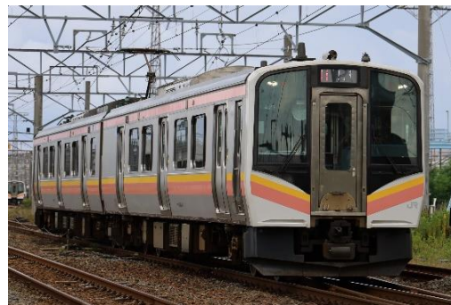
本イベント限定の臨時列車を設定！