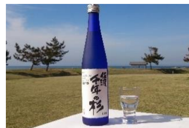
日本酒 佐渡千年の杉

塩をすり込み熟成させて干しあげる村上の名産品です。ご贈答用としても大変喜ばれる一品です。