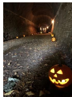
さごやま 三五山トンネル ジャック・オー・ランタンの装飾