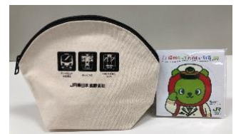
JR オリジナルグッズ

特典: 「駅長アルクマ」メモ帳 & JR オリジナルポーチ ※限定各日 50 名様