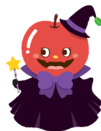
りんごの妖精プルちゃん