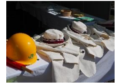
なりきり JR 社員