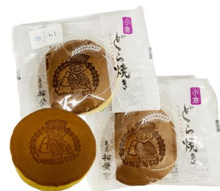
どら焼きイメージ

② 一関狛鼻溪舟下りの 200 円割引券(1 グループ 4 名まで)のついたチラシを限定配布します！