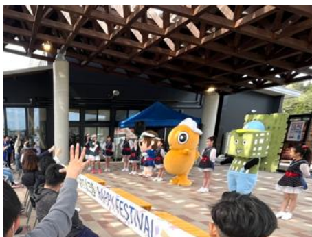
北三陸PRイメージ (キャラクターの出演は無し)