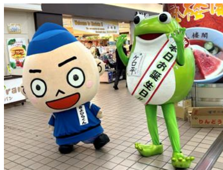
ケロ平・きよひらくんイメージ