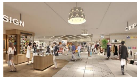
2階：内観イメージパース