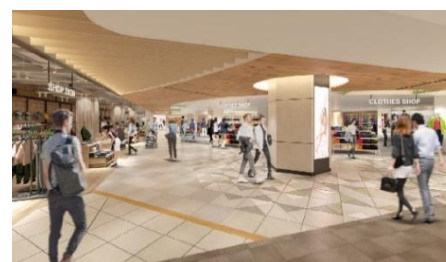
3階：内観イメージパース