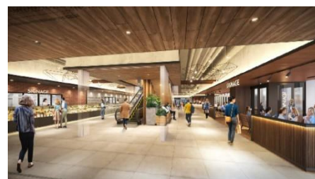
1階：内観イメージパース

好奇心に待ったをかけず、生活を楽しむ。 何気ない日常を豊かに満たし、リアルな生活を充実させたい。 しあわせの循環を生み出す存在でありたい。