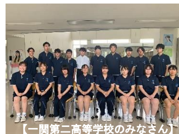
【一関第二高等学校のみなさん】