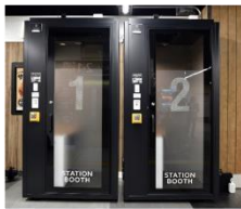
▲ STATION BOOTH