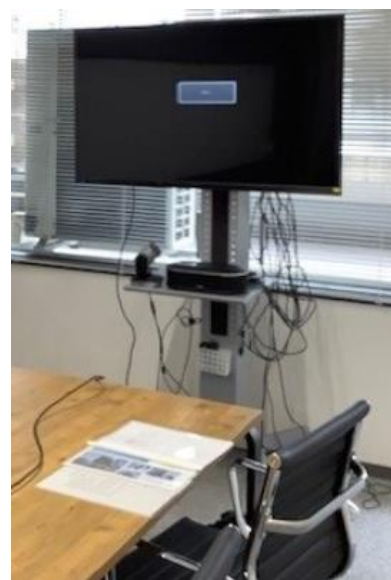
▲モニター・マイク・スピーカー