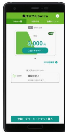
「モバイル Suica 定期券」画面(イメージ)