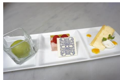
デザートのアソートプレート