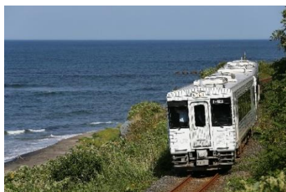
TOHOKU EMOTION 外観