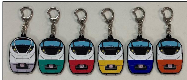
E657系リバイバルカラー ラバーキーホルダー

(2) いわき駅直結「ホテル B4T いわき」では、本イベント参加者の方限定宿泊プランをご用意しています。