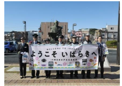
▲当日は JR 社員がご案内します