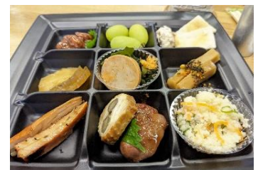
おつまみイメージ