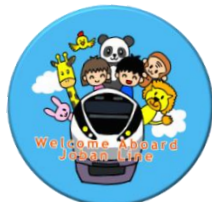
▲オリジナル缶バッジ