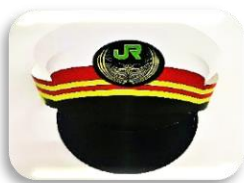
▲駅長サンバイザー