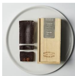
酒粕ガトーショコラ