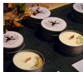
工房マートルのキャンドル