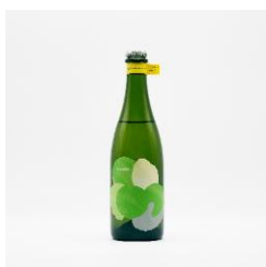
はなうたホップス

マーケットで購入した商品をお店で楽しむほか、今後はイベントスペースとしての活用も予定しております。