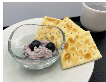
水農産ブルーベリーと 古代米酒粕クリームチーズディップ