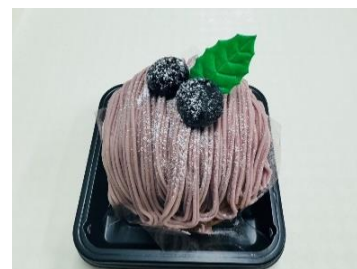
水農産ブルーベリーと笠間栗のモンブラン