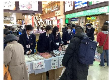
前回の販売会の様子