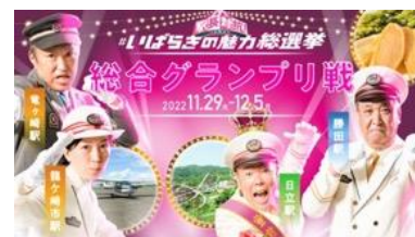
▲昨年の総合グランプリ戦の画像