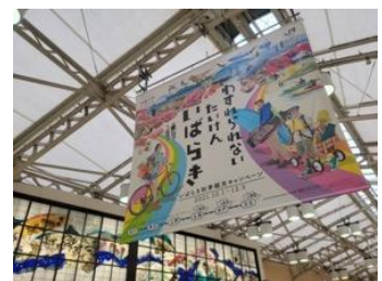
上野駅 大型フラッグ