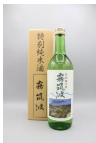
特別純米酒 霧筑波