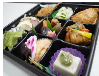
おつまみセットイメージ