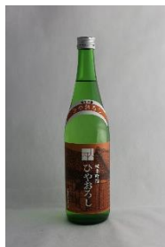
純米吟醸 ひやおろし 愛山