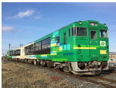
【びゅうコースター風っこ イメージ】