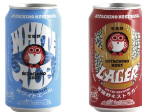
常陸野ネストビール ホワイトエール 常陸野ネストビール ラガー