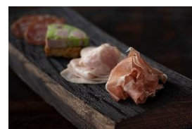
常陸野ハム工房 BARREL SMOKE 生ハムイメージ