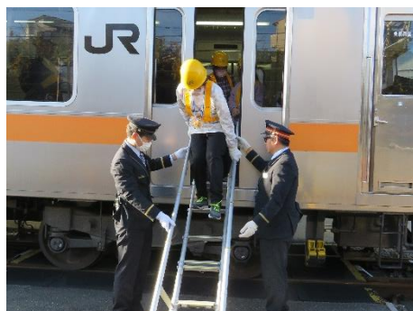
【避難用はしごを使用した降車体験】