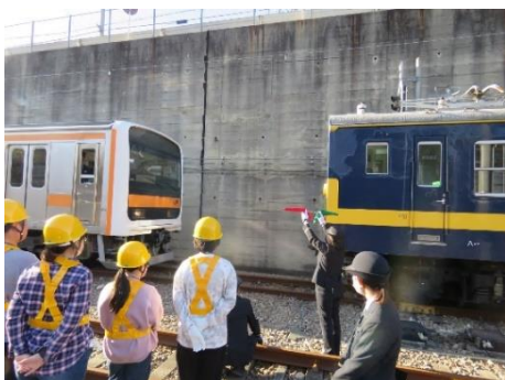
【訓練車の連結作業見学】