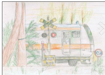
青梅市立第五小学校