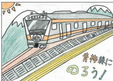
青梅市立第一小学校