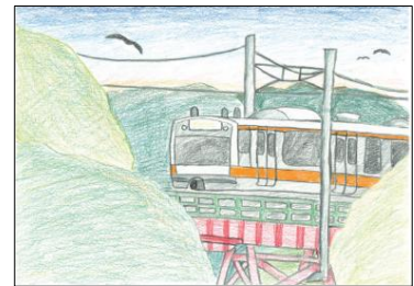
青梅市立第六小学校