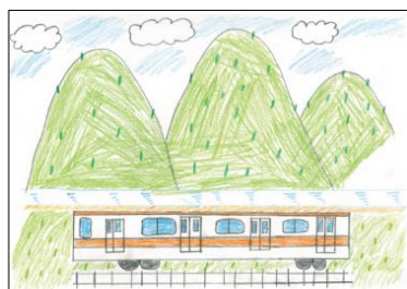
奥多摩町立氷川小学校