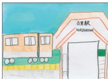
奥多摩町立古里小学校

応募いただいた335作品を 東京アドベンチャーライン専用 ラッピング列車に展示して 運行します。