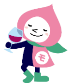
JRの山梨キャラクター モモずきん