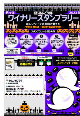
【パンフレット兼スタンプ台紙イメージ】