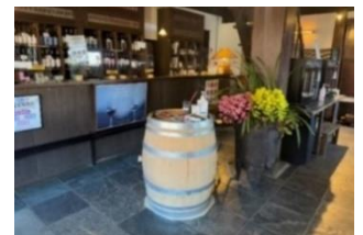
【ワイナリーのイメージ写真】