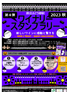
【ポスターイメージ】