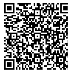
▲予約専用フォーム