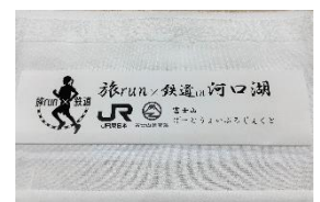
オリジナルタオルイメージ