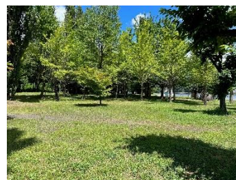
大池公園 イベント会場イメージ

(2) 場 所：大池公園（山梨県南都留郡富士河口湖町船津 6713-18） 河口湖駅から徒歩 20 分、最寄りバス停：河口湖ハーブ館