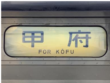
211系 側面行先表示 (幕式)